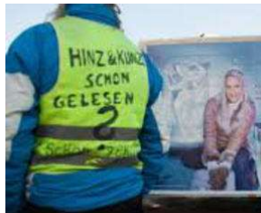
SIE kommt spät - aber sie KOMMT !! von Erich Heeder