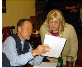
7 Jahre TextLabor Bergedorf - eine ganz besondere offene... von Charlene Wolff