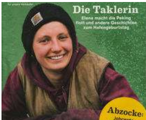
AB MITTWOCH auf dem Lohbrügger Markt !! von Erich Heeder